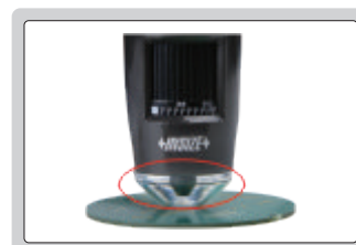
anillo soporte del foco para 600X